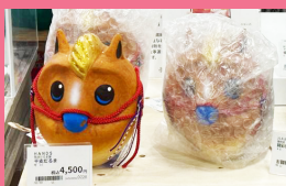
平塚店の干支コーナーに 置いていただきました♪

繁忙期中のことです。午の干支だるまを東急ハンズ・平塚店で取り扱いさせていただきますと、ご連絡がありました。平塚店の店長さんが読売新聞に掲載された午の干支だるまを見て、かわいいと喜んでくださり、職場でも干支だるまを集めている従業員さんが何人かいたようで、是非とも平塚店に置きたい！と強く思ったそうです。東急ハンズさんに取り扱っていただくには、決まり事や書類の提出などがあり時間的には大変でしたが、店頭で午の干支だるまを見かけた時は嬉しくてほっこりしました。