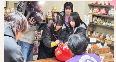
3人で順番に1つの目を入れました。