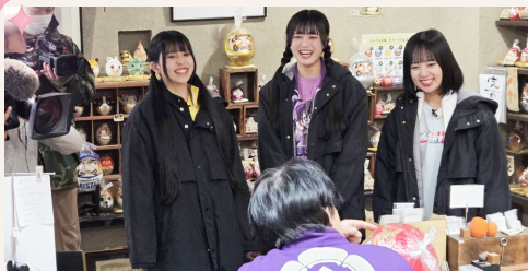
笑顔いっぱいのだるまの話を聞いてくれました♪

『関内デビル』では、Appare! という9人のアイドルグループから3人のメンバーに来ていただき、宿場町・平塚の『相州だるま』についての歴史を学んだ後に、だるまに目入れをして2ndシングル『ヒット祈願』をしていただきました。オーダーのだるまのお腹には、グループ名と2ndシングル名の『Appare! 気にしないっ』、顔の左右には『2ndシングル』『ヒット祈願』と入れています。プロデューサーさんとはお打ち合わせをしましたが、Appare! の3人にはサプライズのプレゼントでしたので、目を輝かせてとても喜んでくれました。作り手として大変嬉しかったです。