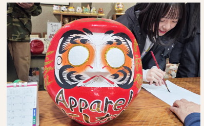
ヒット祈願のだるまです。無事に願いが叶って両目が入りますように。

だるまに目入れをするのが初めてのようで、熱心に紙に練習をしてから3人で目入れをしました。順番を決めるにも楽しそうで、仲の良さが伝わります。素直で明るい女の子達で♪応援したくなりました。2ndシングル『きにしないっ』は、元気でかわいい曲です。是非聞いてみてくださいね!